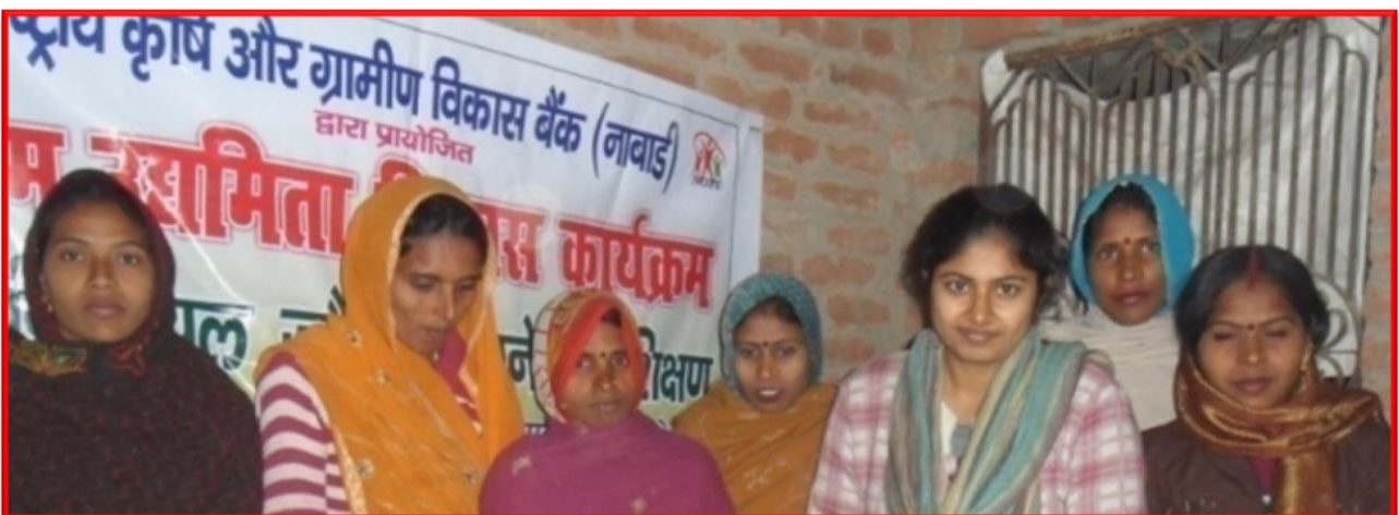
Figure 6 Micro Entrepreneurship Development Programme