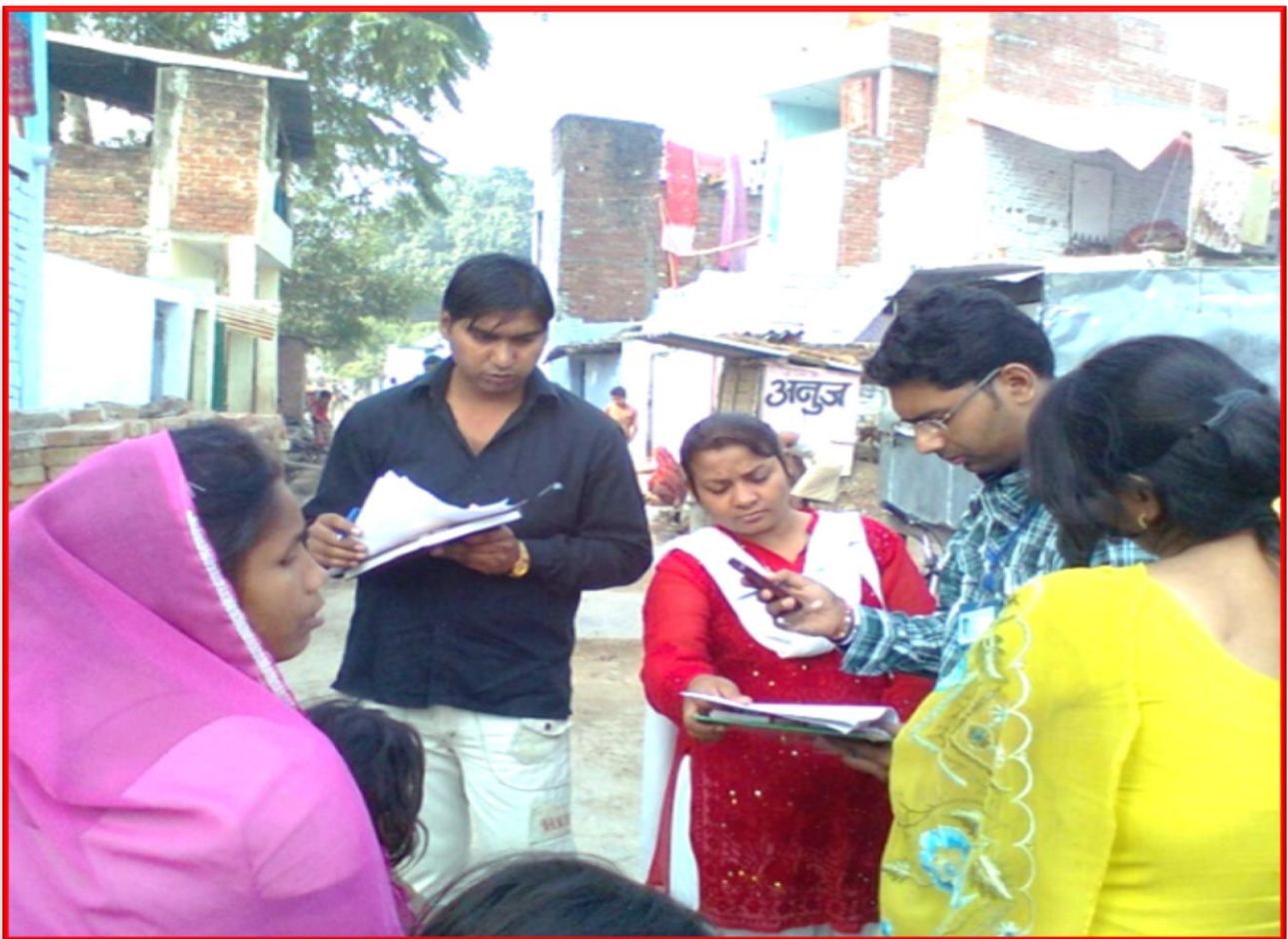
Figure 9 Worked with Trash Dealers surrounding Kanpur

Details of the Programme: The students of Department of Social Work have Worked with Trash dealers and Rag pickers on behalf of Nagar Nigam and A2Z Infra. Ltd. So, we got to know the problems they are facing and how can they support municipal corporation to make this city clean.