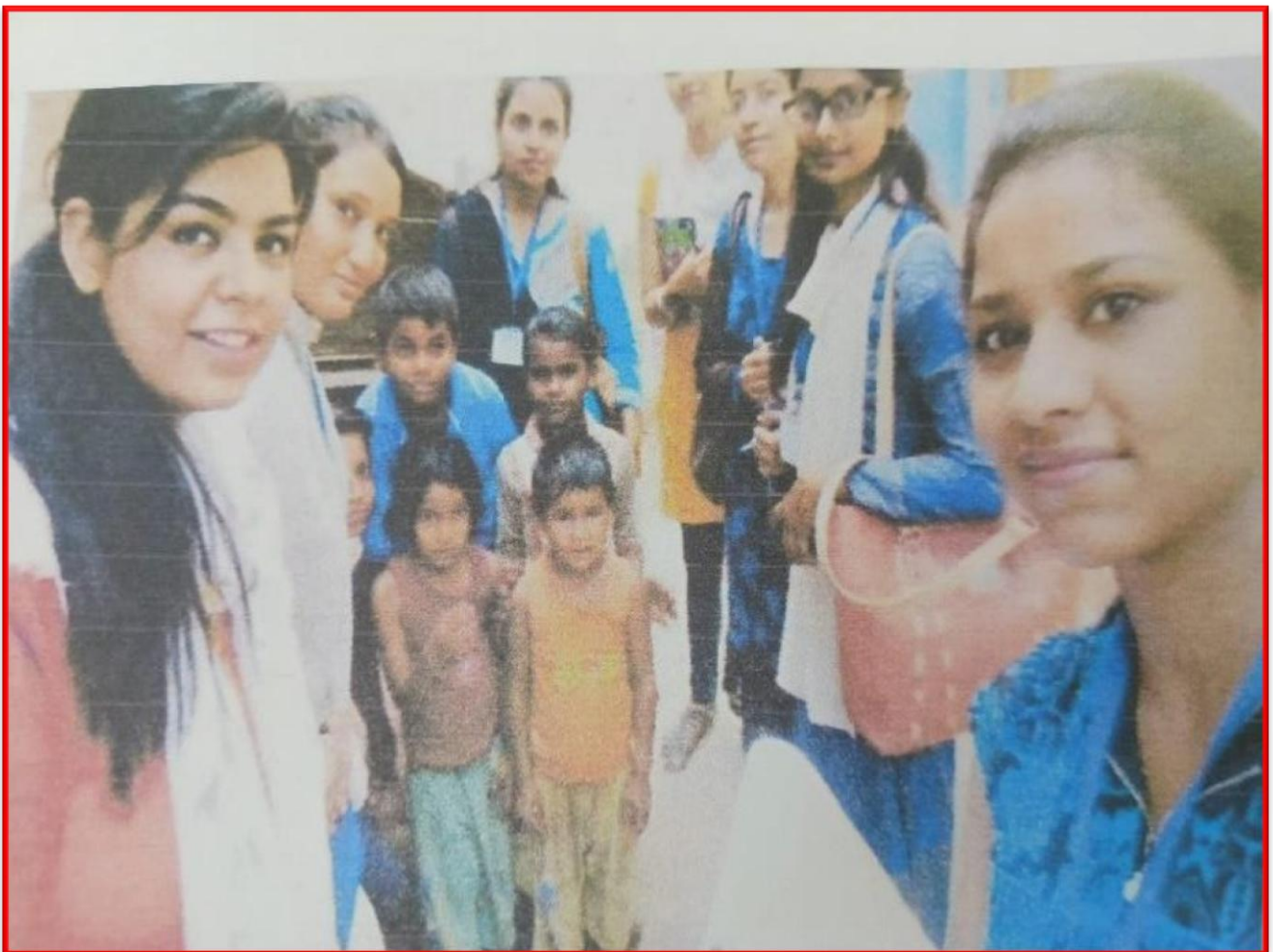
Figure 28 Primary Health Check-up

Details of the Programme: शिक्षा विभाग के विद्यार्थियों एवं एनएसएसएस स्वयंसेवक, छत्रपति शाहू जी महाराज विश्वविद्यालय, कानपुर द्वारा दिनांक 11 मार्च 2018 को आयोजित “प्राथमिक स्वास्थ्य परीक्षण” के माध्यम से बच्चों की प्राथमिक स्वास्थ्य जाँच की गयी तथा उन्हें प्रतिदिन दांतों की सफाई करने, स्नान करने और साफ सुथरे कपड़े पहनने के लिए प्रेरित किया गया।