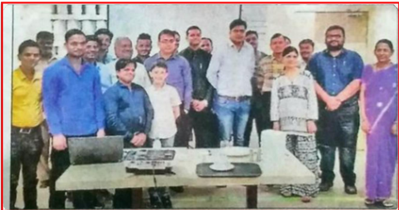
Figure 25 Table Tennis in Canteen