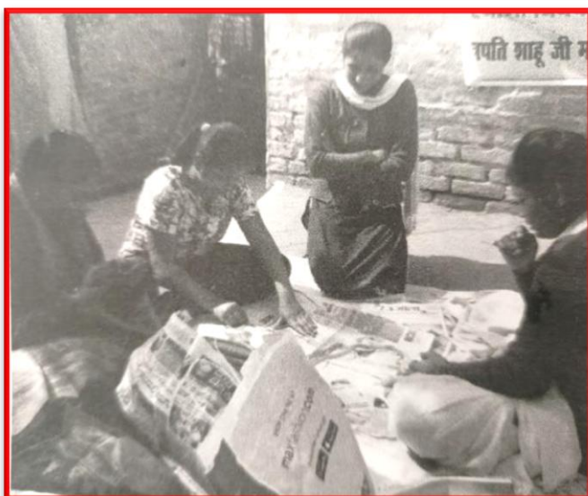
Figure 27 Entrepreneurship Workshop