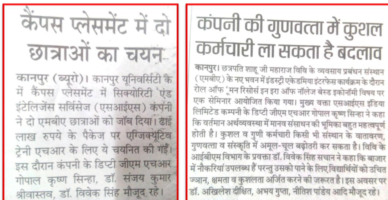
Figure 21 Placement Drive

Organized a Placement drive and lecture for MBA institute of Business Management, CSJM University, Kanpur.