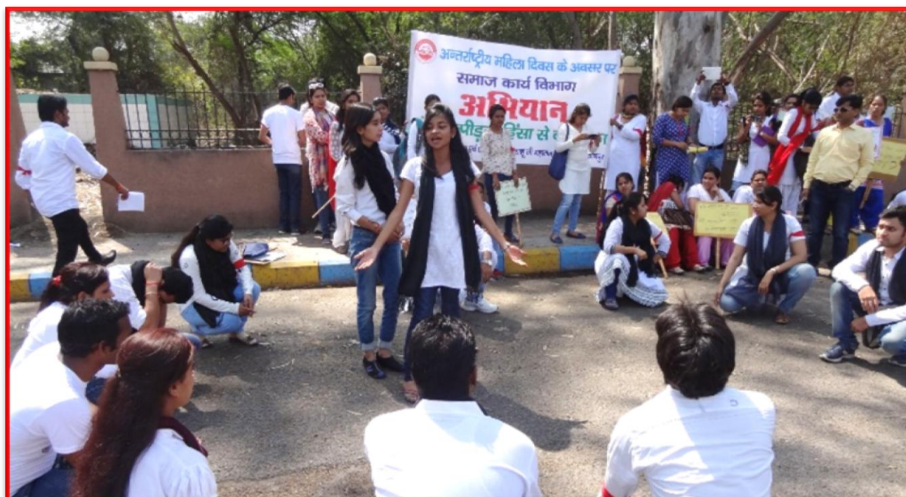
Figure 15 Campaign on #askingforit

Details of the Programme: On the occasion of International Women's Day, the Department of Social Work, CSJM University Kanpur and Breakthrough organization collaboratively conducted a Campaign on #askingforit on Sexual Harassment, PWDV Act with the students of Master of Social Work. This campaign was the successor of the workshop on "Bell Bajao Abhiyaan", where the students were trained on the act and laws related to women and how the women can save them from the unfavorable situations. The campaign was followed by Rally and Street Play at Asha Devi Temple, Kalyanpur; in this play students circulated the message to community that they must be stood up against their sexual harassment and domestic violence.