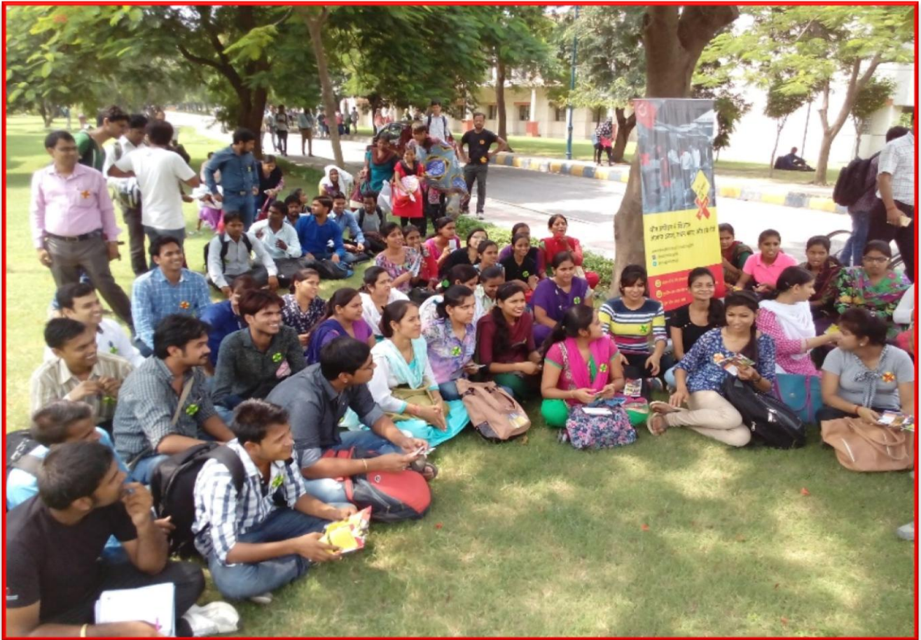
Figure 13 Skill Building on “Bell Bajao Abhiyaan”