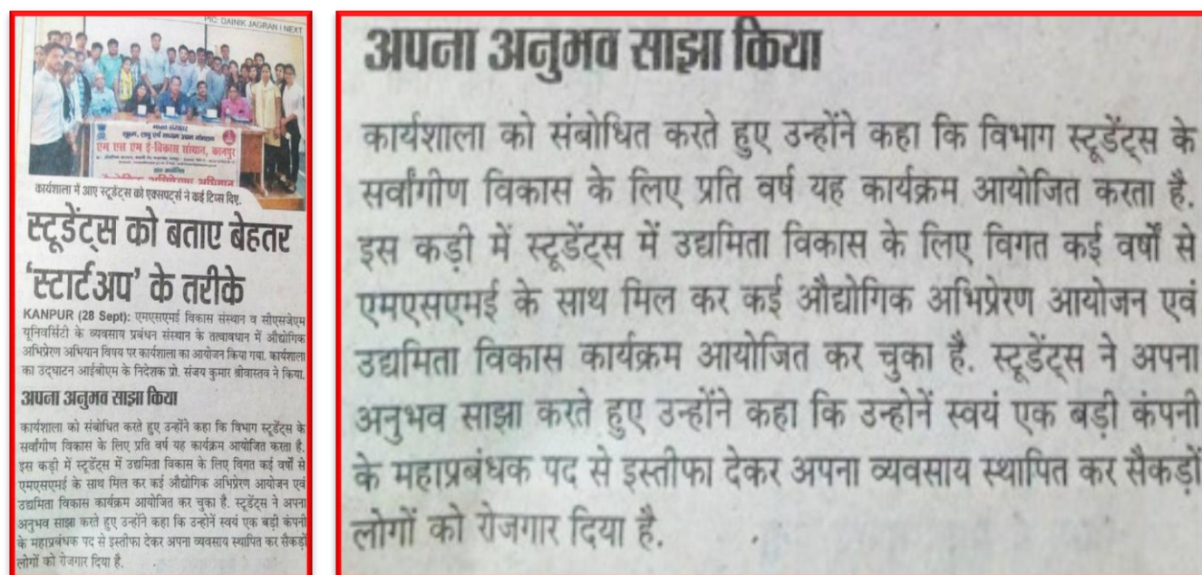
Figure 22 Industrial Motivation Campaign

Organized One day " Industrial Motivation Campaign" in collaboration with MSME DI Kanpur.