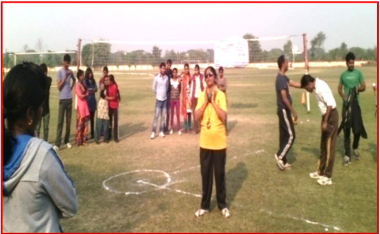
Figure 1 Community Coaches Training Program

Details of the Programme: Department of Social Work and 'Special Olympic Bharat' organized a Community Coaches Training Program, the program was sponsored by Ministry of Youth Affairs & Sports, Govt. of India. The objective of this training was to train special children in different games and make them feel proud that they are also giving their contribution to make this country bright