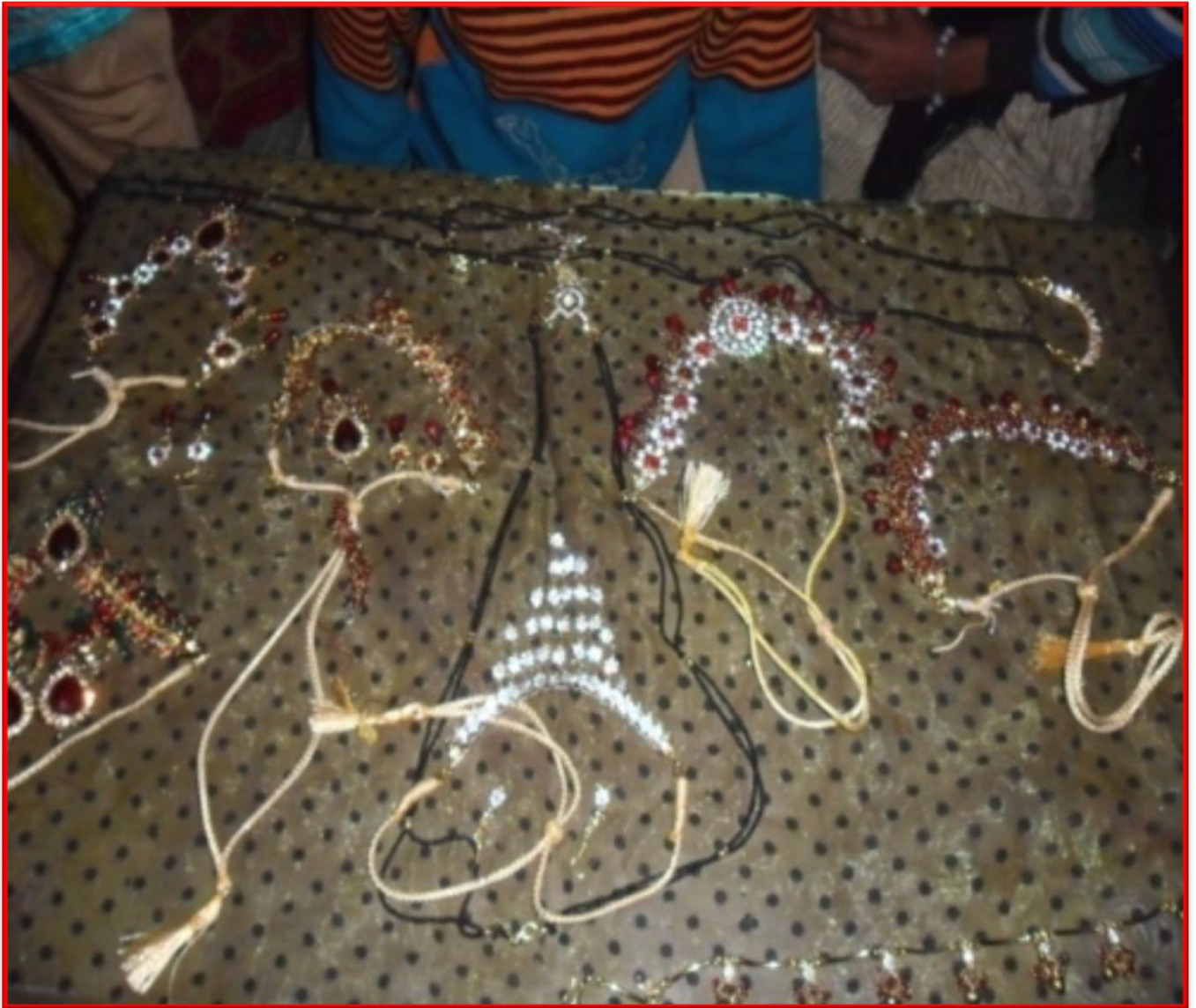
Figure 5 Jewellery Making Training Programme