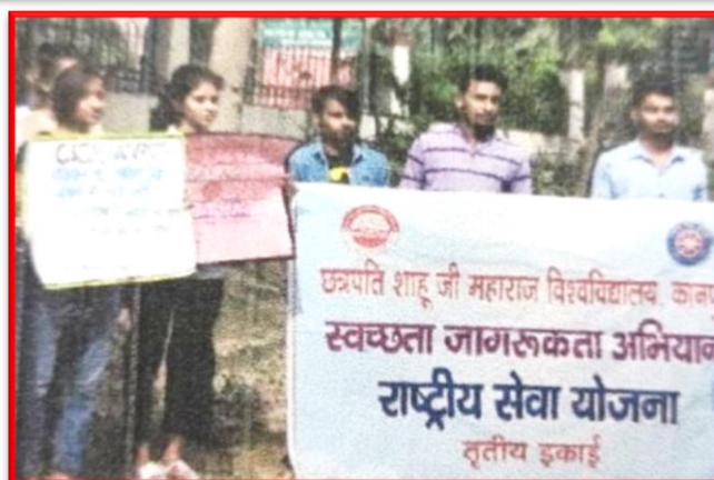
Figure 29 Polythene-Free Awareness Campaign

C.S.J.M. University, Kanpur, U.P. (208024)