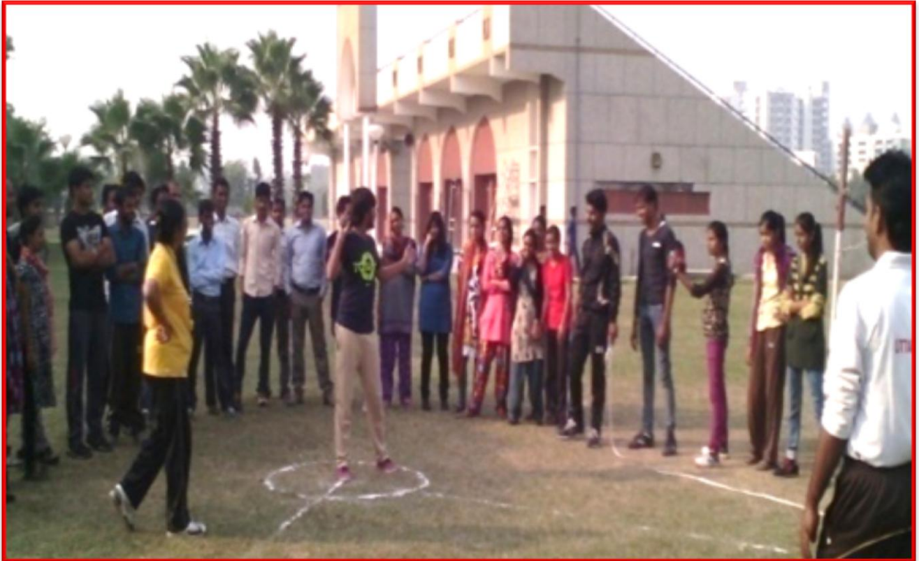
Figure 2 Community Coaches Training Program