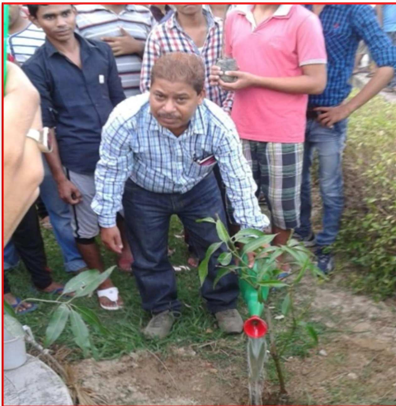
Figure 18 Tree plantation Drive

3. Feb 22, 2018: Tree plantation Drive in hostels_ 72 students participated in the event.