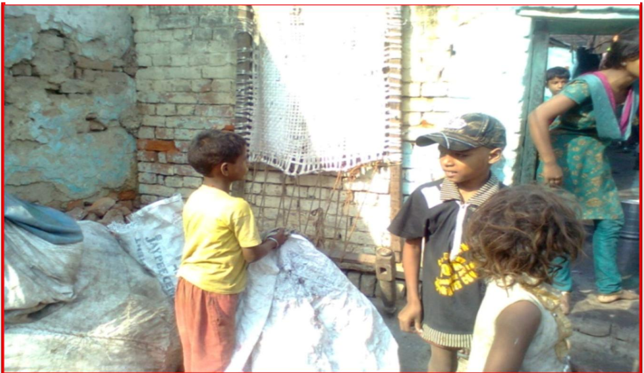
Figure 11 Worked with Trash Dealers surrounding Kanpur