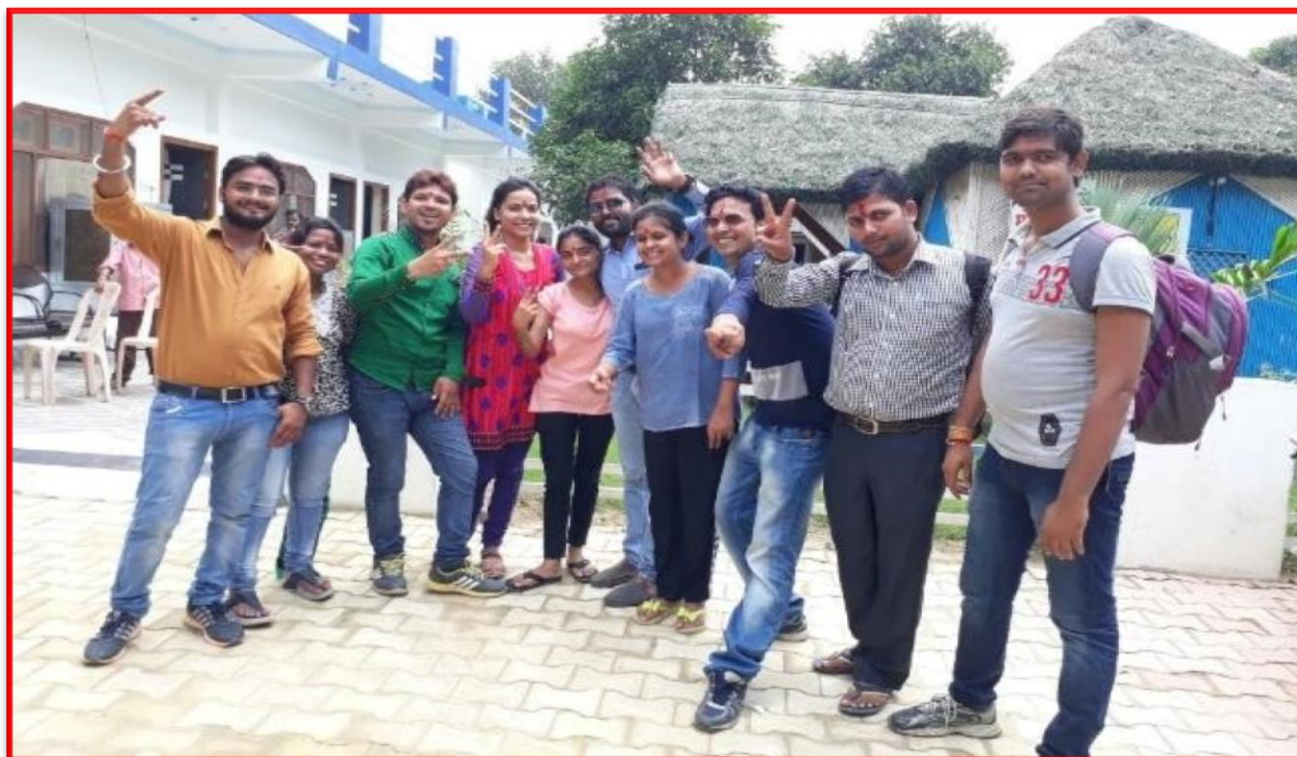
Figure 17 ‘Samuday’ Project

Details of the Programme: Group of 15 students selected for the 60 days monitoring programme in the month of June and July’ 2018 with HCL Foundation. Our students worked there as a Field Monitor in ‘Samuday Project’ ran by HCL Foundation and monitored by John Hopkins University, USA at Hardoi. They were mainly responsible for monitoring of baseline surveys which was being done by the field surveyors of ‘Kantar - IMRB International organization’. The survey was on Community development, which included Open Defecation Free, Sanitation, Cleanliness, Maternal Health, Child Health, Livelihood and Educati.