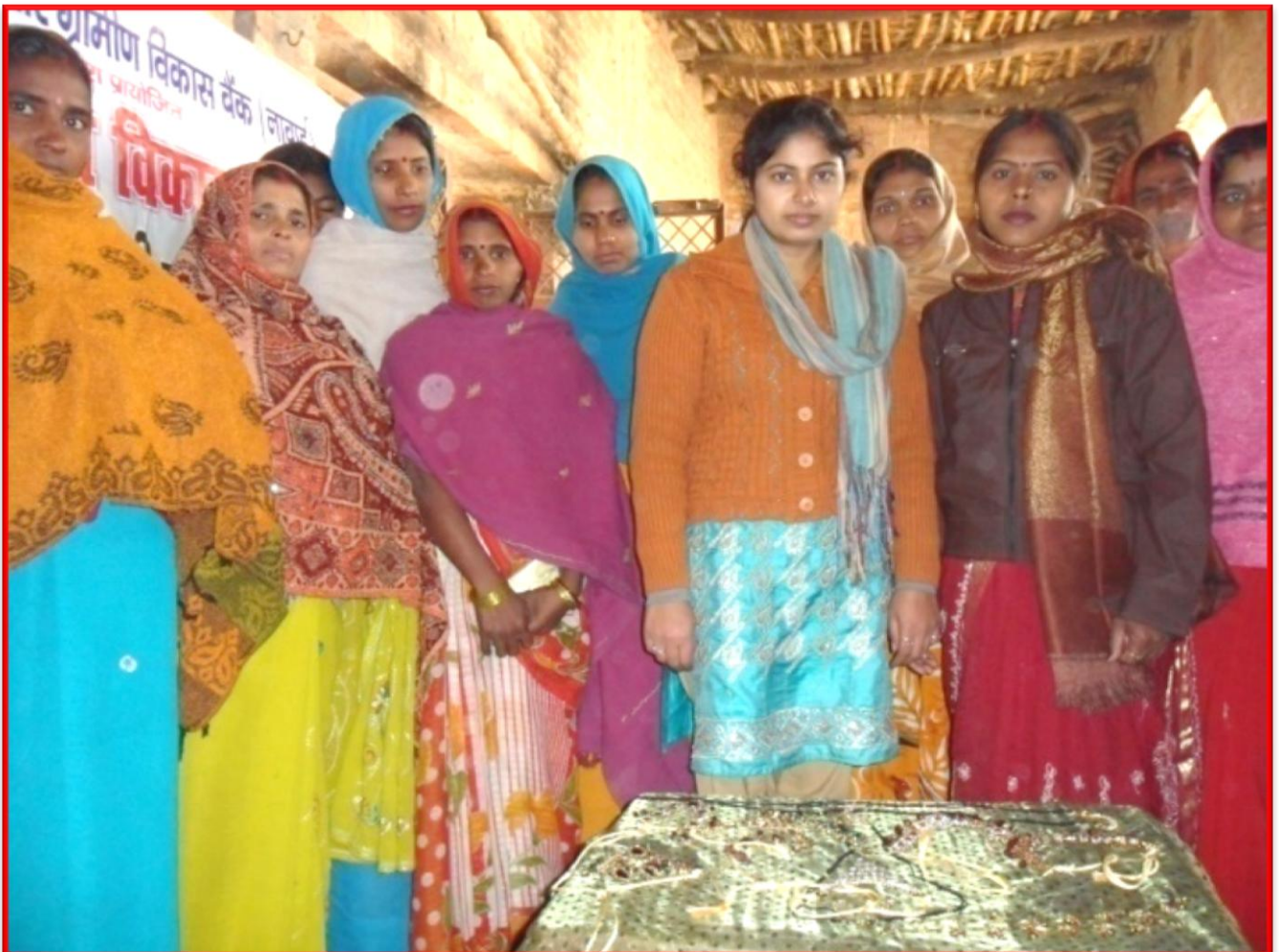
Figure 4 Jewellery Making Training Programme

Details of the Programme: Department of Social Work and NOTS organization conducted a jewelry making training programme in Maitha block, district Kanpur Dehat. After this training programme, the women were able to increase their income and uplift their lifestyle.