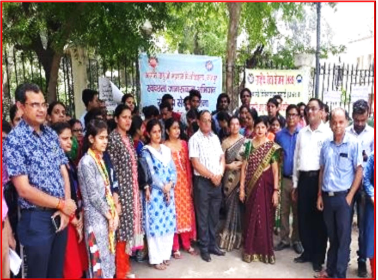
Figure 32 Swachhata Abhiyan