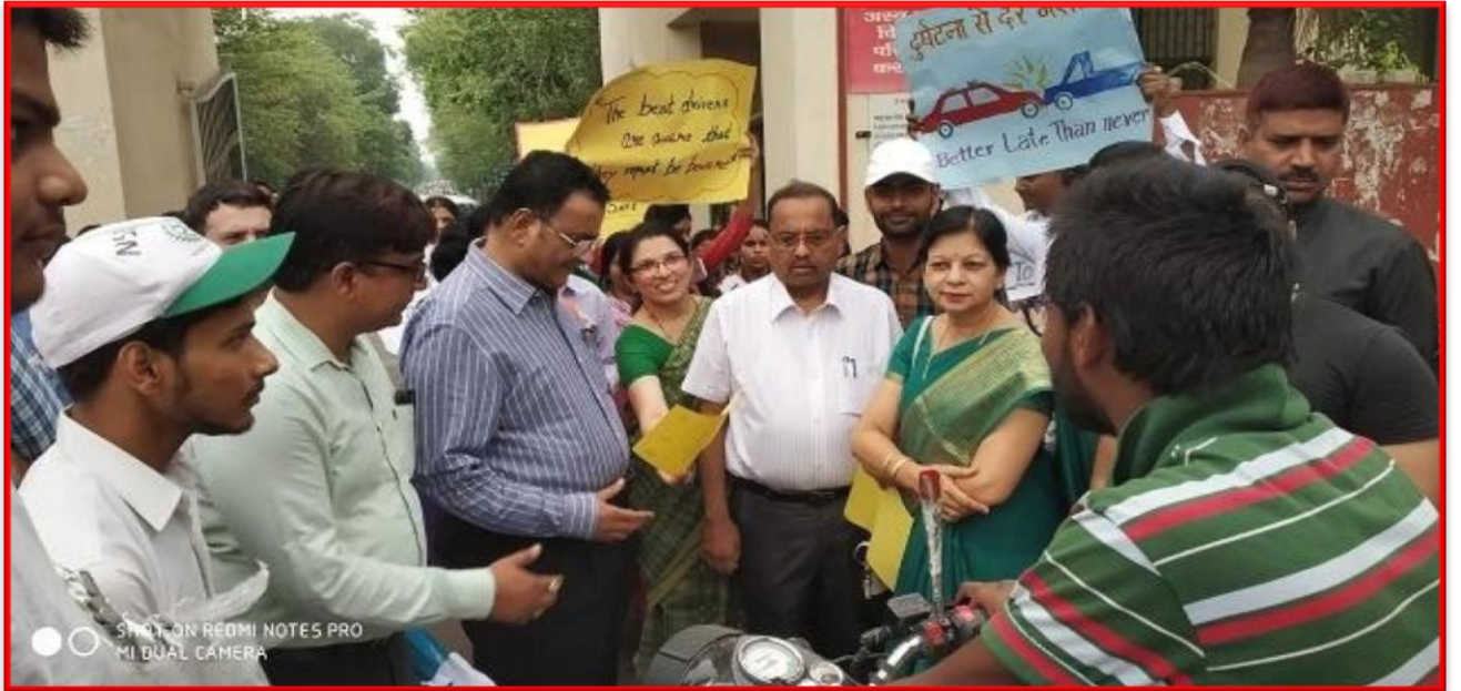
Figure 33 Traffic Rule Awareness Programme

इस अवसर पर स्वयंसेवकों ने हेलमेट न लगाने वाले और सीट बेल्ट न लगाने वाले लोगों को गुलाब का फूल देकर यातायात नियमों का पालन करने के लिए प्रेरित किया।