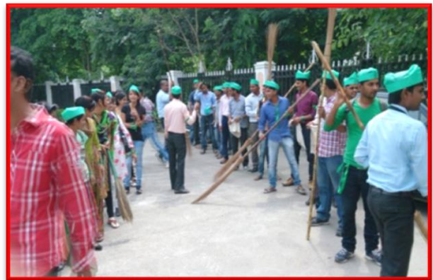
Figure 8 Swachhta Jagrukta Abhiyaan