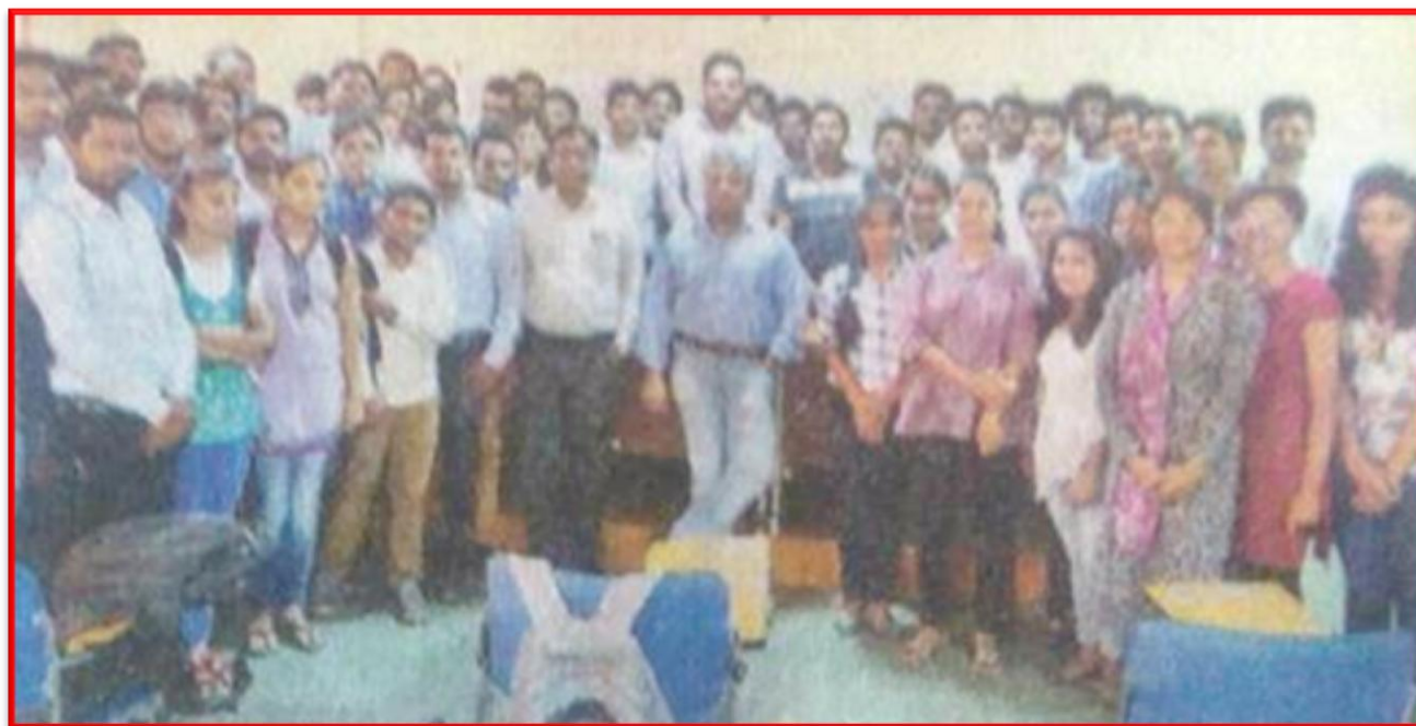
Figure 20 Industry Academia Interface