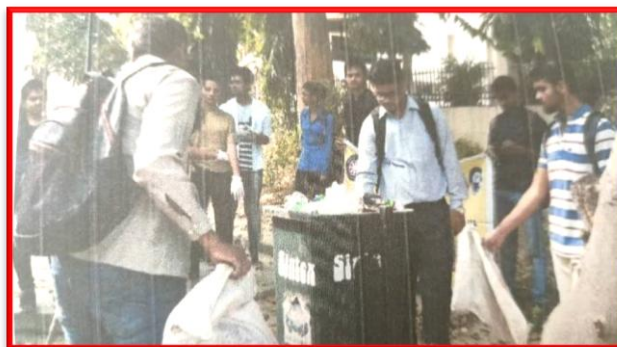
Figure 30 Cleanness Awareness Campaign