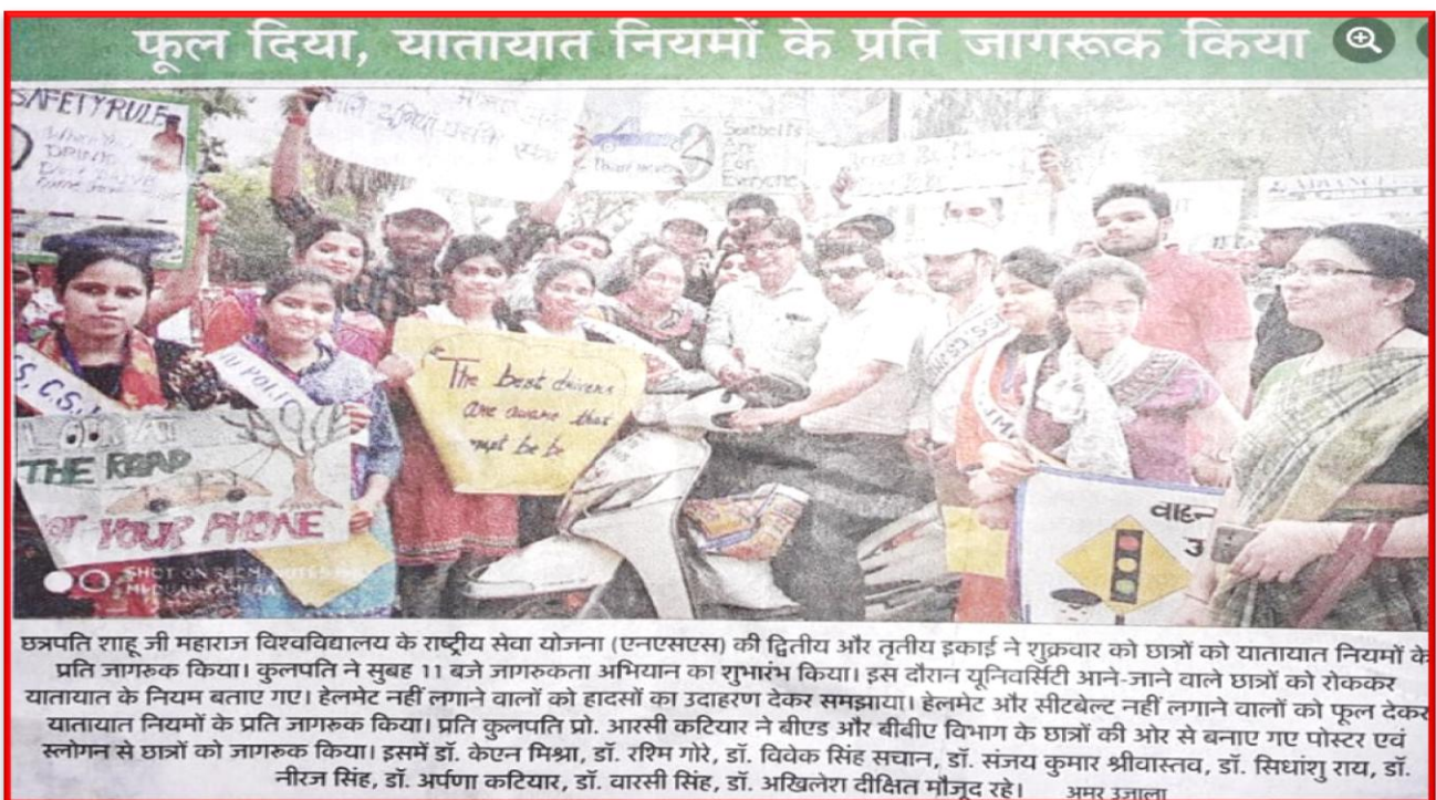
Figure 24 traffic rule awareness programme