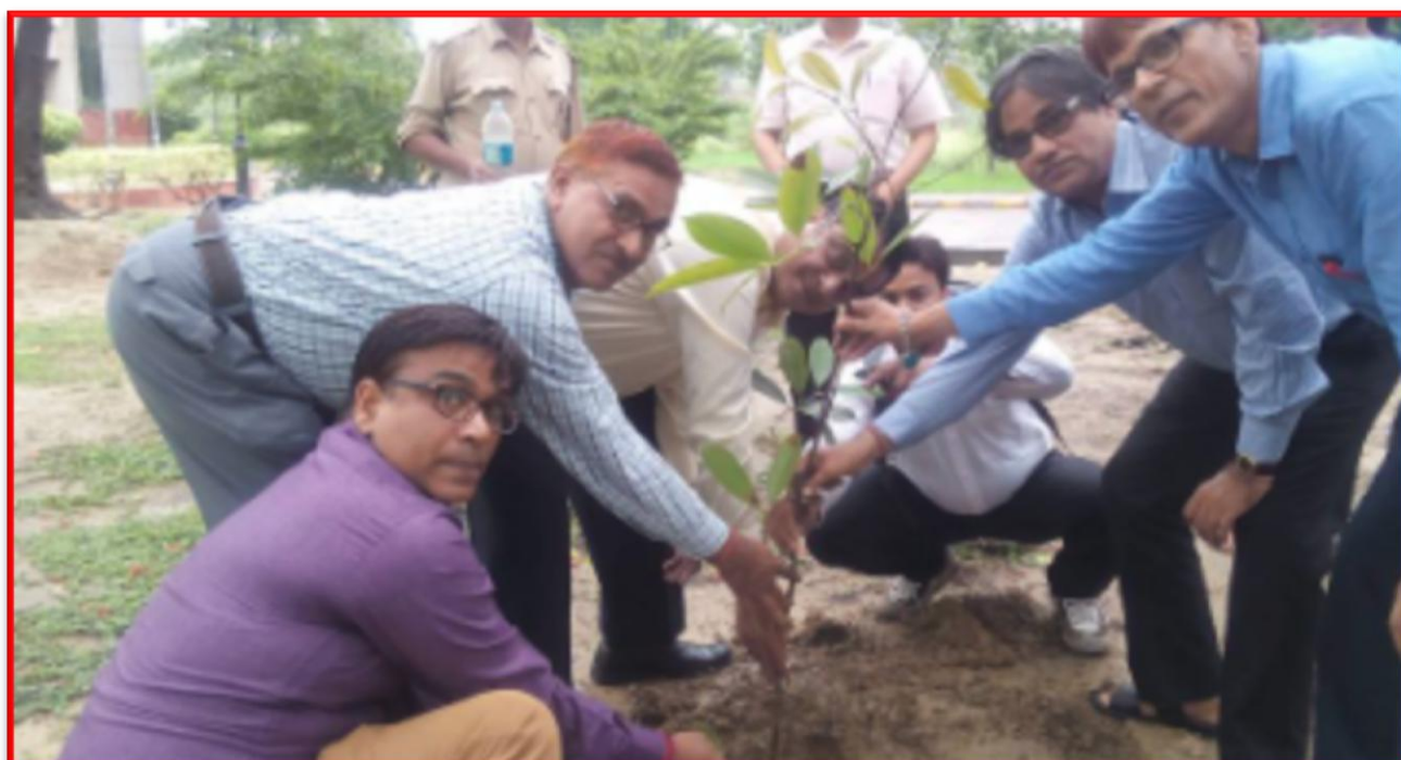
Figure 19 Tree Plantation Drive

C.S.J.M. University, Kanpur, U.P. (208024)