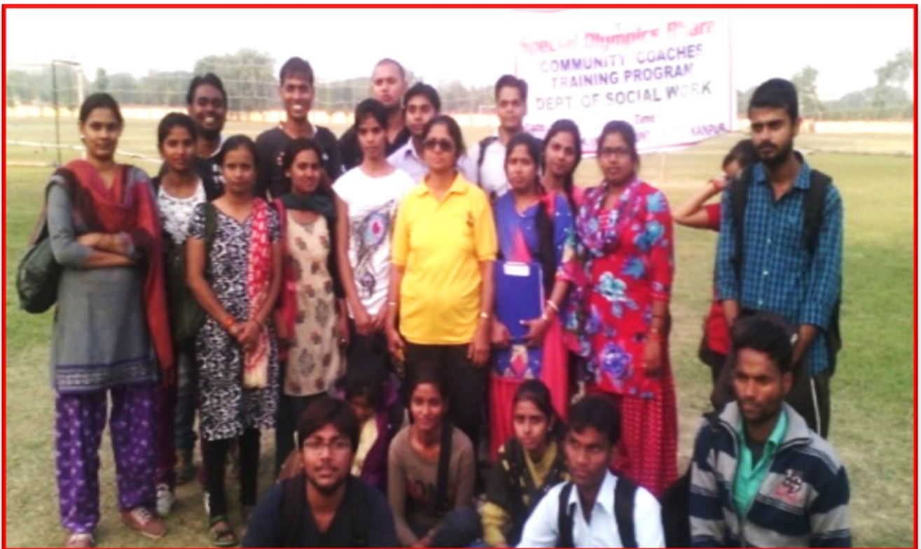
Figure 3 Community Coaches Training Program