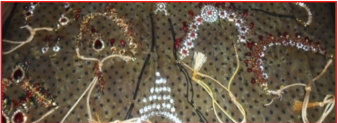
Figure 6 Jewellery Making Training Programme

C.S.J.M. University, Kanpur, U.P. (208024)