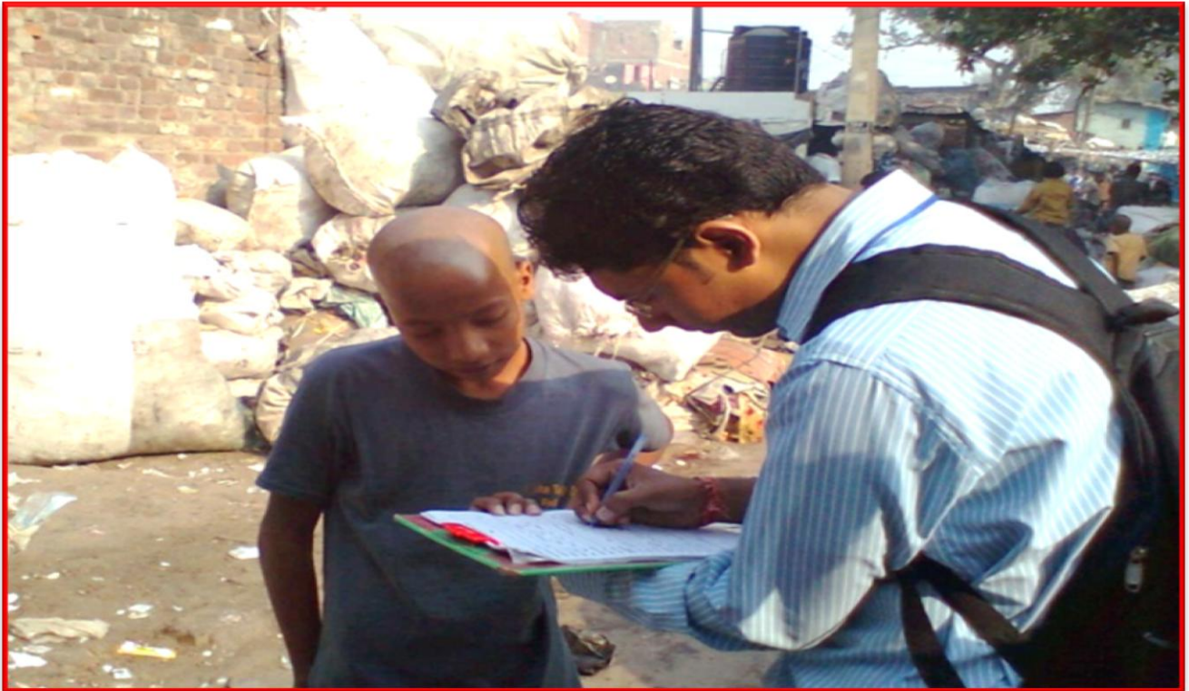
Figure 10 Worked with Trash Dealers surrounding Kanpur