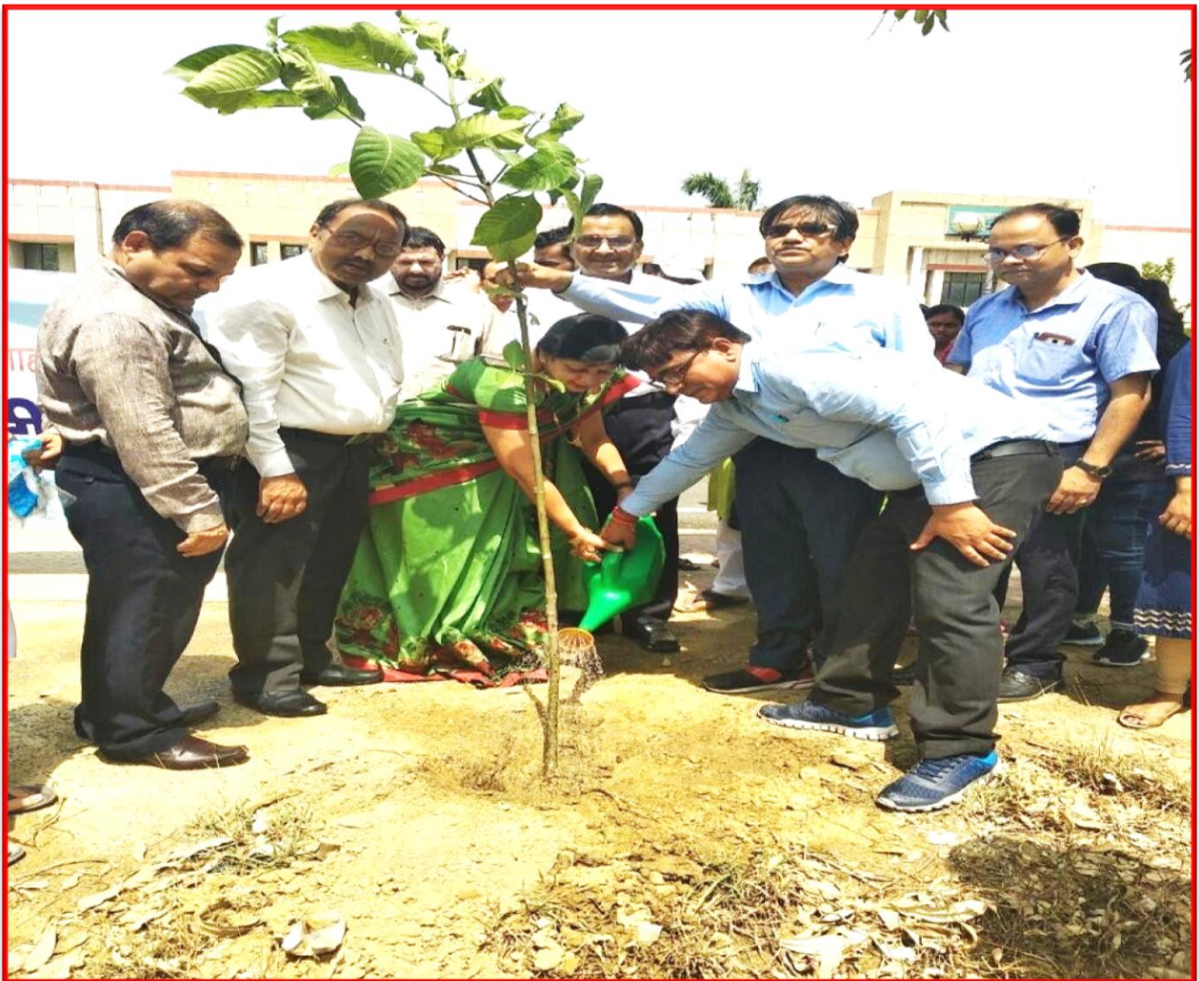
Figure 31 Plantation Programme