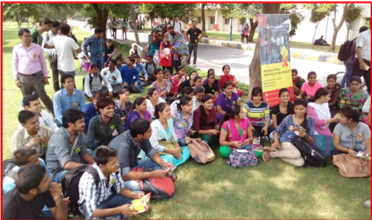
Figure 12 Skill Building on “Bell Bajao Abhiyaan”

Details of the Programme: The Department of Social Work, CSJM University Kanpur and Breakthrough organization collaboratively conducted a skill building workshop on “Bell Bajao Abhiyaan” with the students of Master of Social Work and other departments. In this workshop, the students were trained on the act and laws related to women and how the women can save them from the unfavorable situations; in that situation they will have to do just make some noise so the people of surrounding can help them.