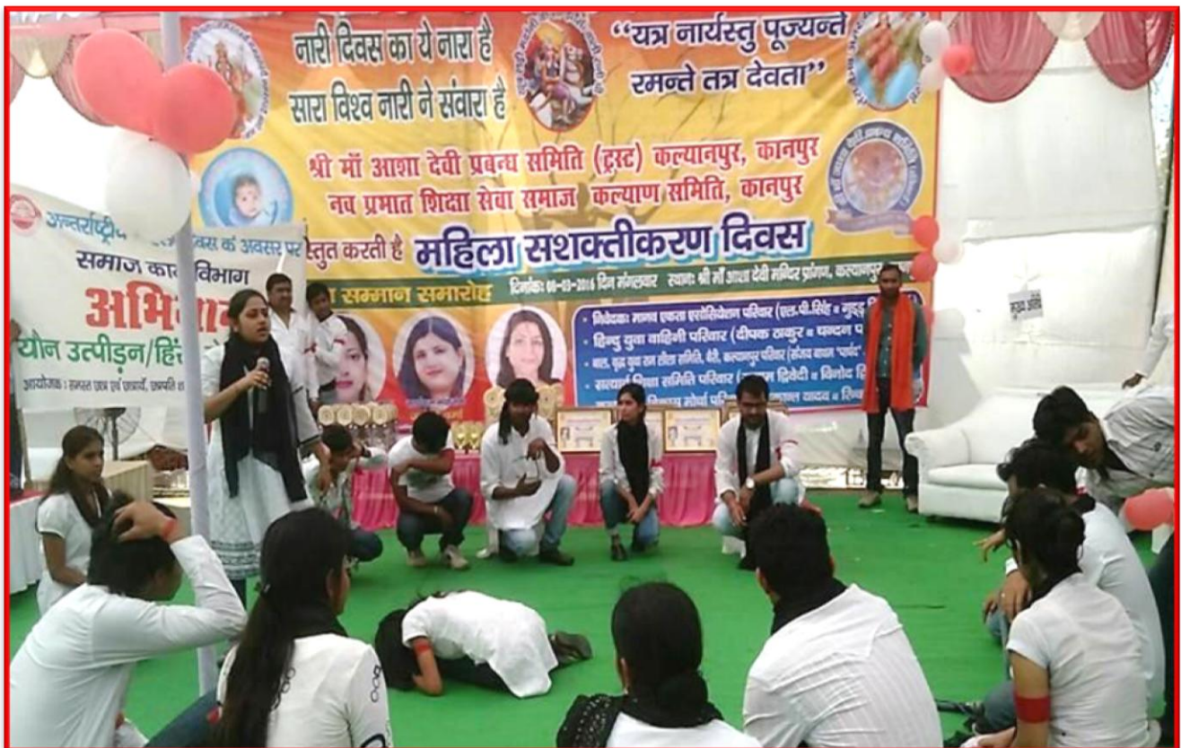
Figure 16 Campaign on #askingforit